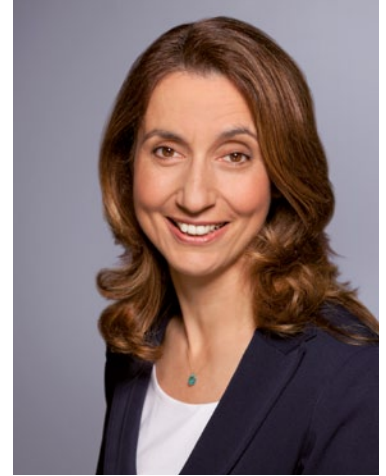
AYDAN ÖZOĞUZ Staatsministerin bei der Bundeskanzlerin Beauftragte der Bundesregierung für Migration, Flüchtlinge und Integration

Ich wünsche eine interessante Lektüre und hoffe, dass Sie sich auch weiterhin so engagiert für Flüchtlinge einsetzen. Sie leisten damit einen wichtigen Beitrag zum Zusammenhalt in unserem Land.