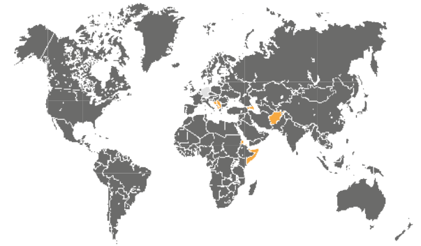
» Hauptherkunftsländer im Jahr 2014

Diese Broschüre bezieht sich auf den Sachstand vom März 2015.